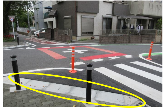
段差解消と待機場所の確保