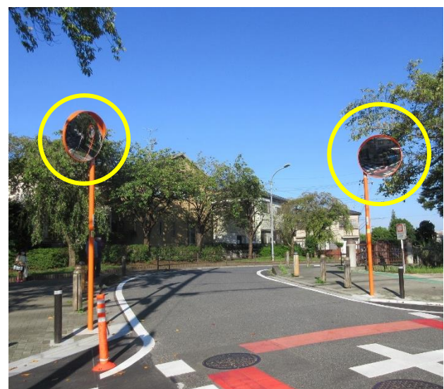
右側は、左側より大きいサイズ