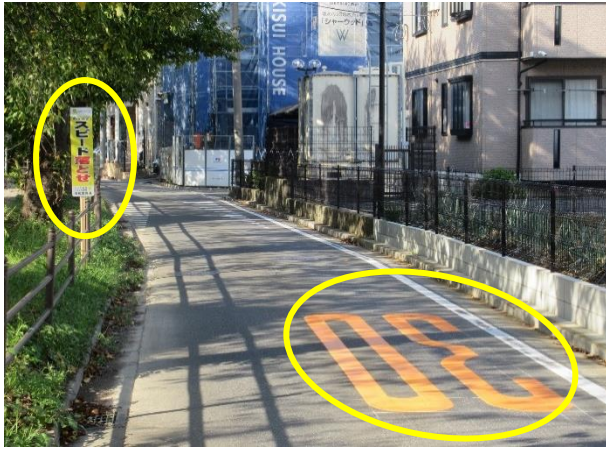
看板（ソフトサイン）と路面標示