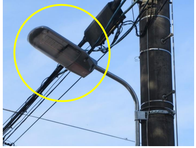
街路灯の交換 (位置調整、照度向上)