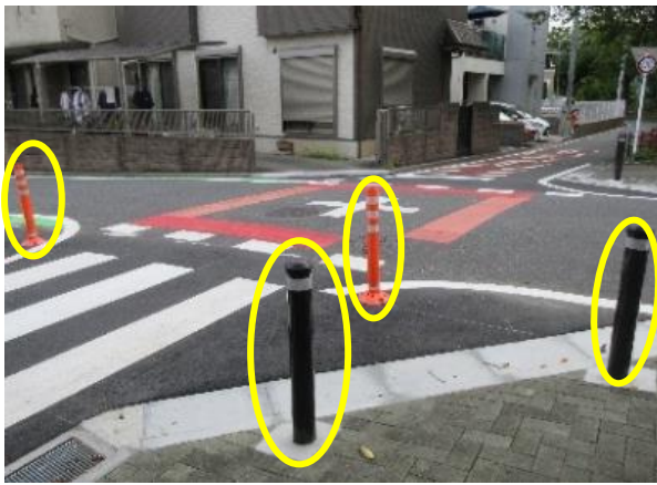
車止め、オレンジ色のラバーポール