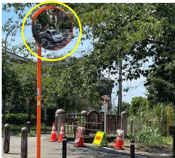
大型の丸型カーブミラー