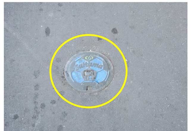
水道管仕切弁の蓋を小さい物に変更（2カ所）