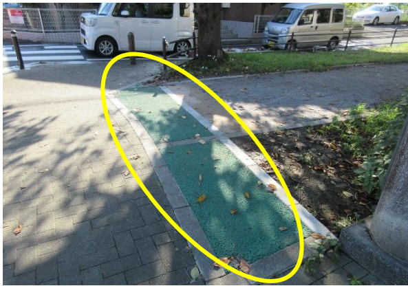
横断歩道待機場所の確保